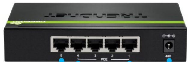
Un puerto Gigabit | 4 puertos PoE+ Gigabit | Alimentación