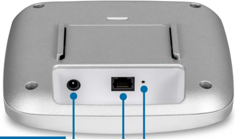
1 x 802.3at PoE+ 2.5GBASE-T LAN port (power input)