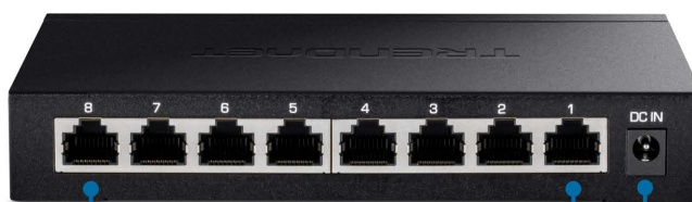
8 x porte 2.5G RJ-45 (1Gbps/2,5Gbps)