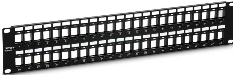
Tableau de connexion HD 2U Keystone vierge à 48 ports