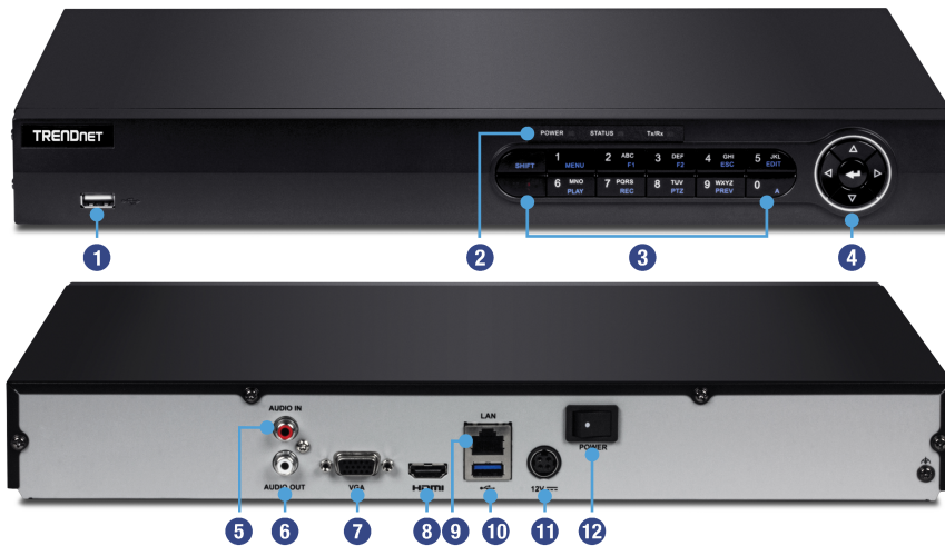
Illustration Eines Network

Benutzer finden die Verwaltungsoberfläche intuitiv und einfach zu verwenden – Sie können leicht zwischen Liveansichtspräferenzen, Aufzeichnungsplänen und fortgeschrittenen Wiedergabeoptionen wechseln.