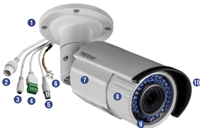
Illustration Eines Network

Geeignet für extreme Bedingungen mit Wetterschutzklasse IP66 und einem Betriebstemperaturbereich von -30 – 60°C (-22 – 140°F).