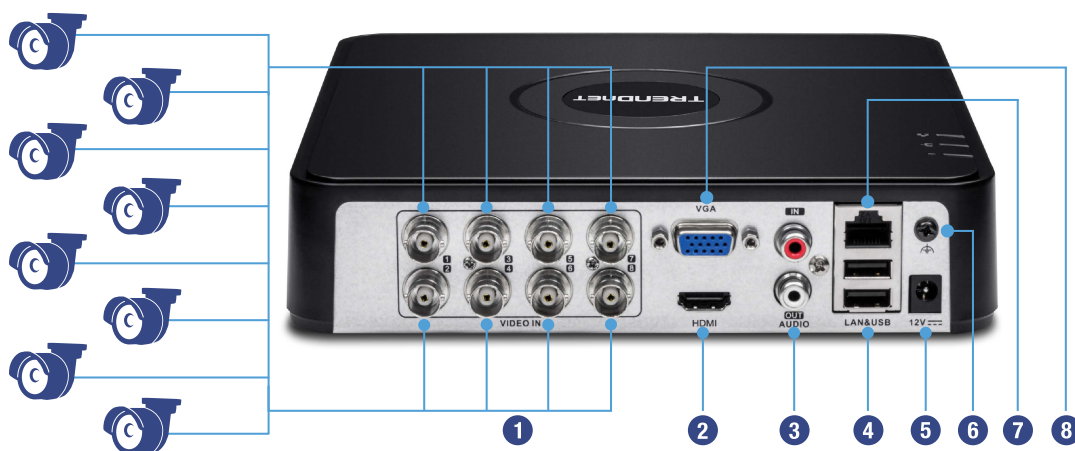
Illustration Eines Network

Benutzer finden die Verwaltungsoberfläche intuitiv und einfach zu verwenden – Sie können leicht zwischen Liveansichtspräferenzen, Aufzeichnungsplänen und fortgeschrittenen Wiedergabeoptionen wechseln.