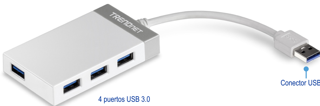
4 puertos USB 3.0