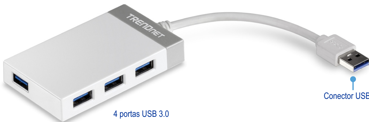
4 portas USB 3.0