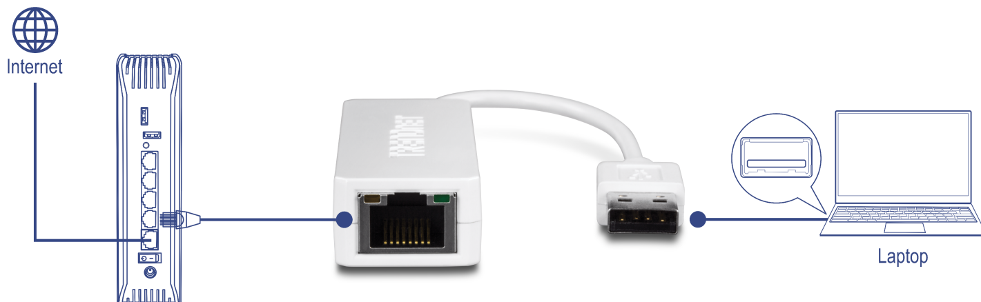
Illustration Eines Network

Erleben Sie Vollduplex 200 Mbps Ethernet-Geschwindigkeit mit diesem kompakten USB 2.0 zu Fast Ethernet Adapter.