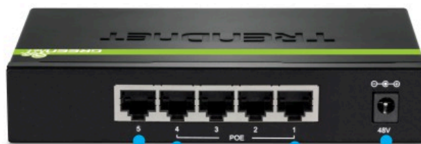
1 porta Gigabit 4 porte Gigabit PoE+ Alimentazione