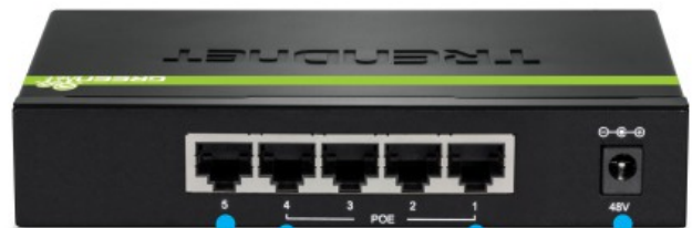
1 port Gigabit