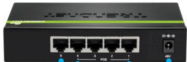
1 x Gigabit port 4 x Gigabit PoE+ ports Power