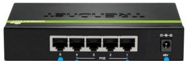
1 x Gigabit-Port