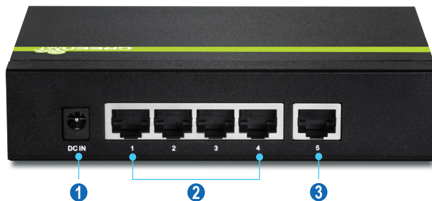
Illustration Eines Netzwerks