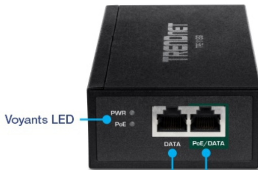
Port Gigabit données entrant