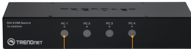
Bottoni del selezionatore del PC