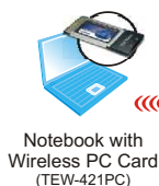
Notebook with Wireless PC Card (TEW-421PC)