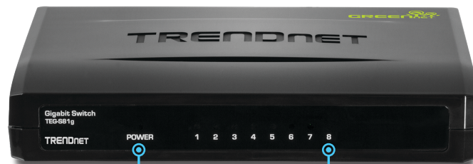
LEDs de diagnóstico