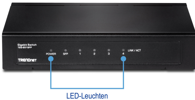
Illustration Eines Network

Stabiles Metallgehäuse mit magnetischer Befestigung