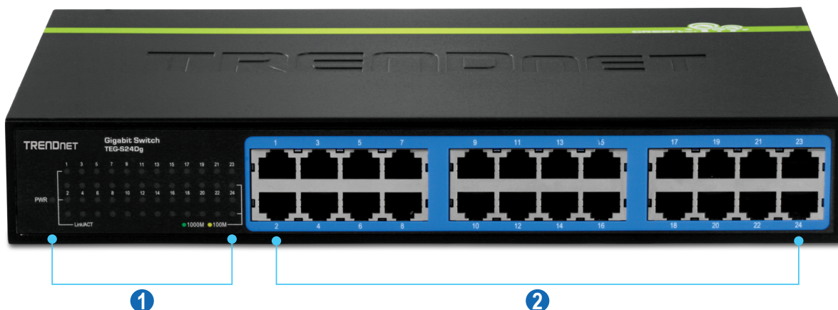
1 Voyants lumineux