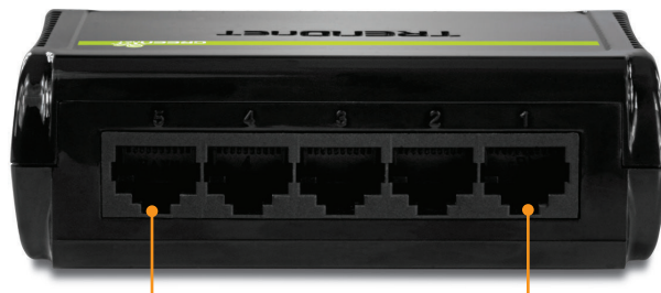
Porte 10/100 Mbps