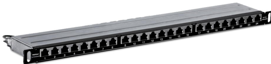
Tableau de connexion demi-U blindé Cat6A à 24 ports