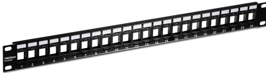
Tableau de connexion 1U Keystone vide à 24 ports