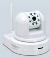
Беспроводная интернет-камера SecurView с функцией поворота в горизонтальной и вертикальной плоскости и увеличением изображения, а также режимом ночного видения TV-IP422W