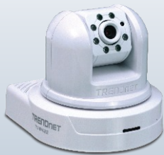
Server telecamera wireless Giorno/Notte Pan/Tilt con audio a 2 vie TV-IP422W

Utilizzare gli switch in fibra TRENDnet per mettere in rete oltre dodici edifici con una stazione di monitoraggio centrale. All'interno di ciascun edificio, gli switch PoE TRENDnet sono stati collegati con splitter PoE, a loro volta connessi a videocamere IP SecurView con funzione day/night pan/tilt. Le videocamere sono gestite e controllate con il software TRENDnet VortexIP Pro 64, insieme con un modulo di espansione a 20 unità per gestire fino a 84 videocamere.